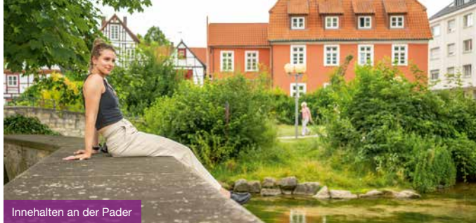
Innehalten an der Pader

führung durch ihr Paderborn. Niveauvoll, mit Charme und Witz führt Sie Carsta an die verschiedensten und schönsten Sehenswürdigkeiten, die Paderborn zu bieten hat. Preis: 15 Euro.