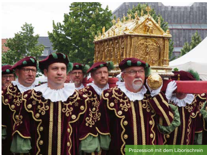
Prozession mit dem Liborischrein