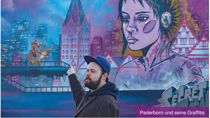
Paderborn und seine Graffitis

maß der Veränderungen durch die unmittelbare Gegenüberstellung von Altem und Neuem.