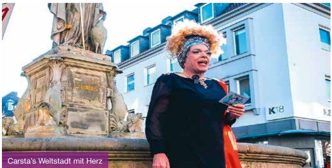
Carsta's Weltstadt mit Herz

Paderborn – früher und heute | Stadtbildwandel in den letzten 100 Jahren Der Wiederaufbau nach dem 2. Weltkrieg wie auch die Baumaßnahmen der letzten Jahre und Jahrzehnte gaben der Innenstadt ein völlig anderes Gesicht. Mit einer Fotomappe in der Hand gehen Sie auf Erkundungsreise und erkennen das Aus-