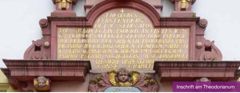
Inschrift am Theodorianum