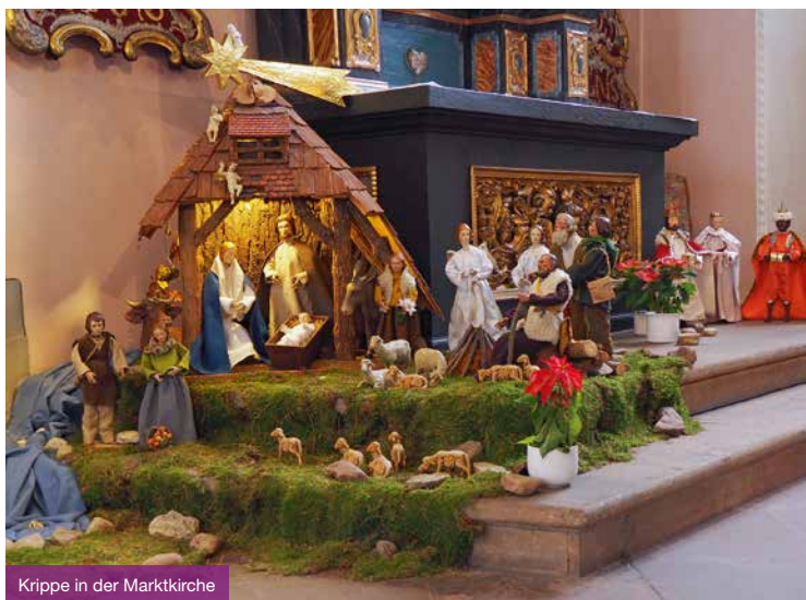
Krippe in der Marktkirche

Stadtrundgang – der Klassiker zum Kennenlernen von Paderborn