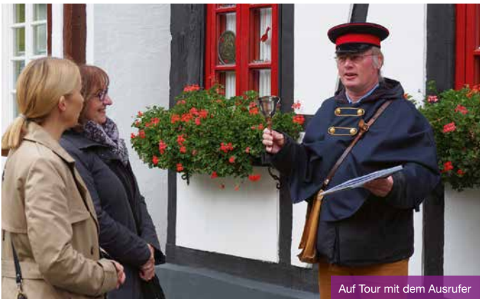
Auf Tour mit dem Ausrufer

Mit blauer Kappe und lauter Schelle ausgerüstet, verkündete der Ausrufer früher Neuigkeiten und las Bekanntmachungen vor. Der Ausrufer bzw. die Ausruferin von heute hat viel aus vergangenen Zeiten zu berichten. Strenge Vorschriften aus der Polizeiverordnung wechseln sich ab mit kuriosen Geschichten von Nachtwächtern, Hornträgern, Türmern und Feuerwächtern.