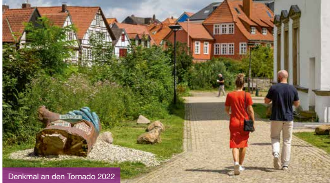
Denkmal an den Tornado 2022