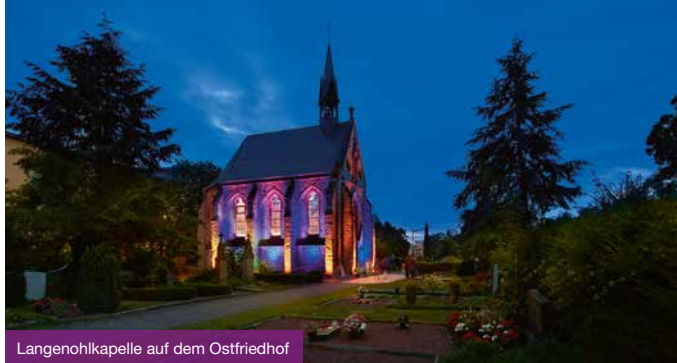
Langenohlkapelle auf dem Ostfriedhof