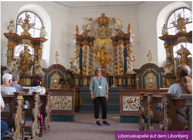
Liboriuskapelle auf dem Liboriberg

Graffitis sind überall in der Stadt zu finden. Auch in Paderborn gibt es eine aktive Szene, die im öffentlichen Raum bereits zahlreiche Werke hinterlassen hat. Für Außenstehende sind sie oft nicht lesbar. Bei dieser Führung erfahren Sie, was hinter den Graffitis steckt, wie sie entstehen und wie sie geschichtlich einzuordnen sind.