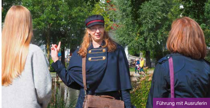
Führung mit Ausruferin