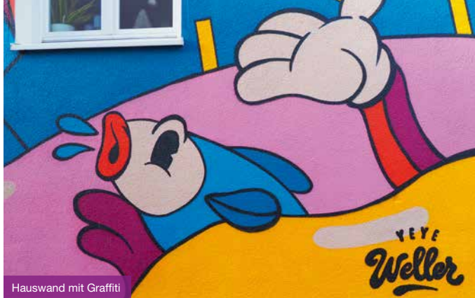
Hauswand mit Graffiti