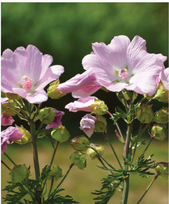
Malva moschata Moschus-Malve