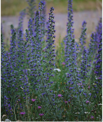
Echium vulgare Gewöhnlicher Natternkopf