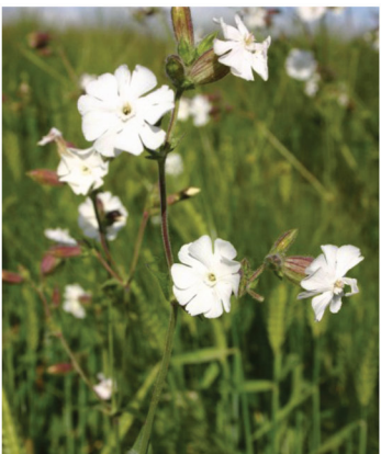
Silene latifolia Weiße Lichtnelke