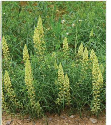
Reseda lutea Gelber Wau