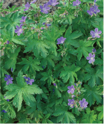
Geranium sylvaticum Wald-Storchschnabel