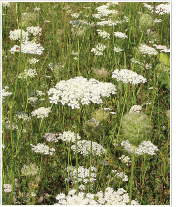
Daucus carota Wilde Möhre