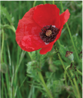
Papaver rhoeas Klatschmohn