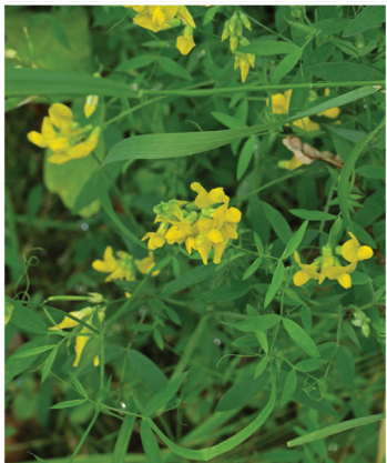
Lathyrus pratensis Wiesen-Platterbse