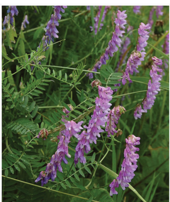
Vicia cracca Vogel-Wicke