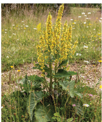
Verbascum nigrum Schwarze Königskerze