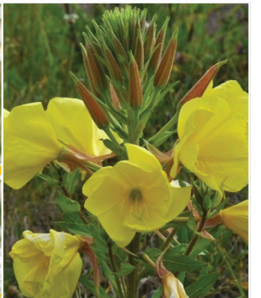
Oenothera biennis Gemeine Nachtkerze