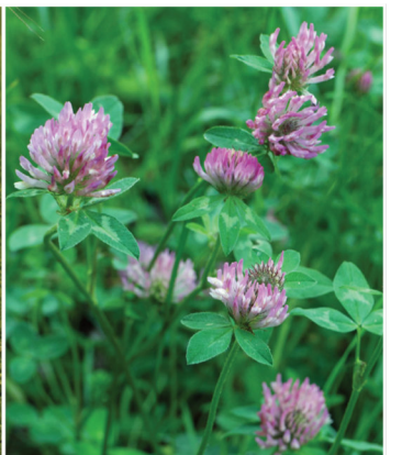
Trifolium pratense Wiesenklee