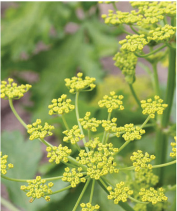
Pastinaca sativa Pastinak