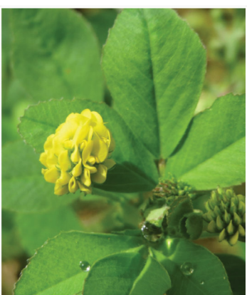
Medicago lupulina Hopfenklee