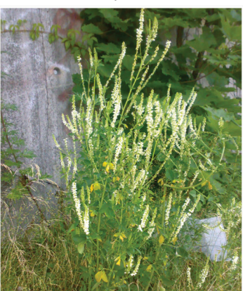
Melilotus albus Weißer Steinklee