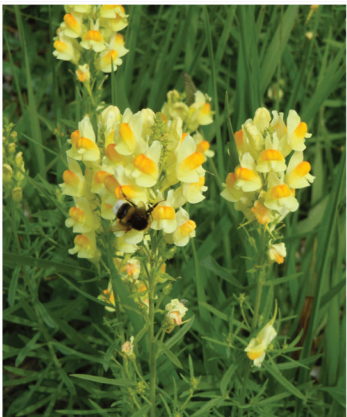
Linaria vulgaris Echtes Leinkraut