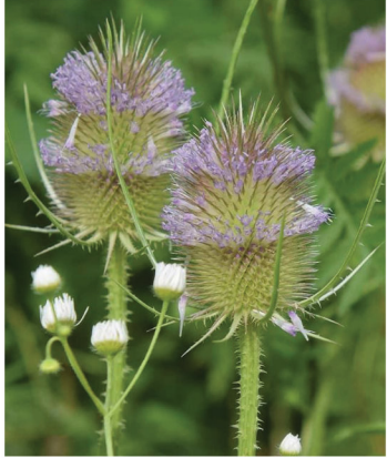
Dipsacus fullonum Wilde Karde