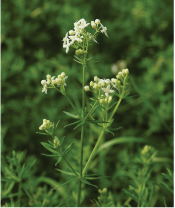
Galium album Weißes Labkraut