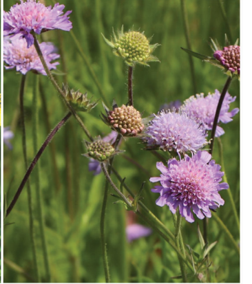
Knautia arvensis Acker-Witwenblume