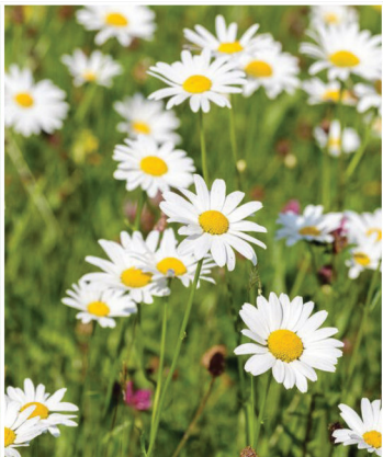
Leucanthemum ircutianum Fettwiesen-Margerite