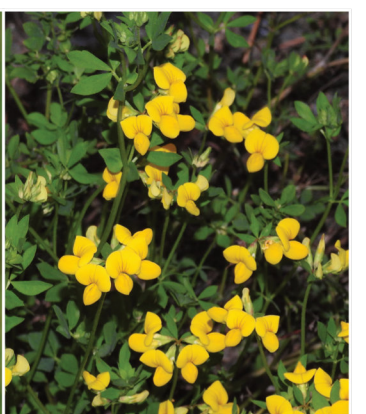
Lotus corniculatus Gewöhnlicher Hornklee