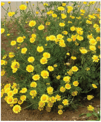
Anthemis tinctoria Färberkamille