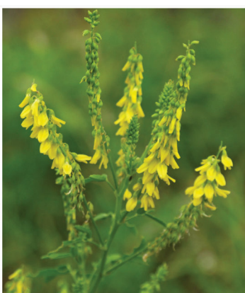
Melilotus officinalis Gelber Steinklee