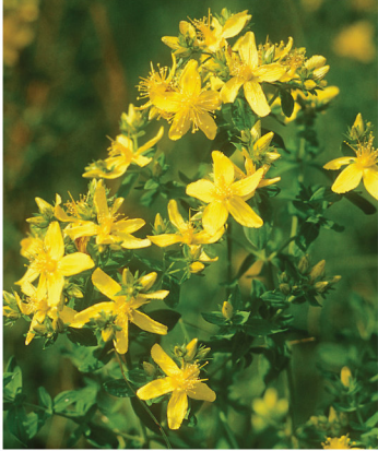
Hypericum perforatum Echtes Johanniskraut