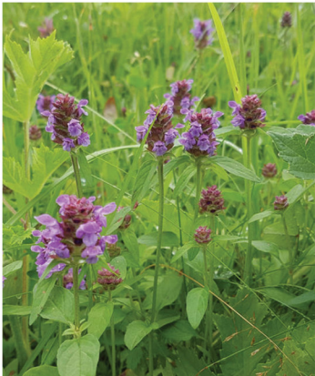
Prunella vulgaris Kleine Braunelle