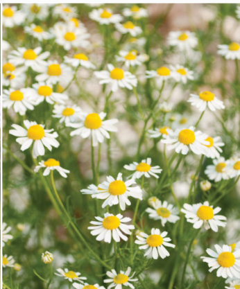
Matricaria recutita Echte Kamille