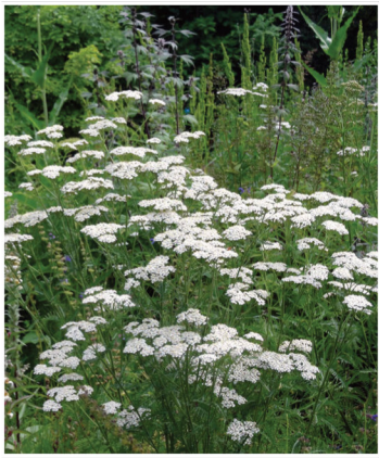
Achillea millefolium Gemeine Schafgarbe