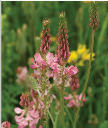
Onobrychis viciifolia Saat-Esparsette