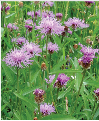
Centaurea jacea Wiesen-Flockenblume