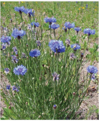
Centaurea cyanus Kornblume