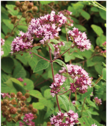
Origanum vulgare Oregano