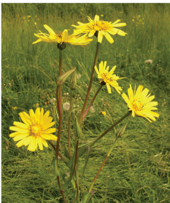
Tragopogon pratensis Wiesen-Bocksbart