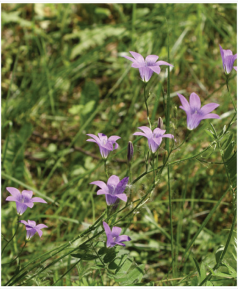
Campanula rapunculus Rapunzel-Glockenblume