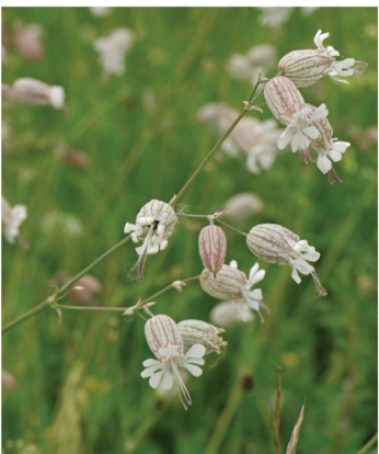
Silene vulgaris Taubenkropf-Leimkraut