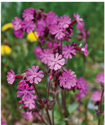
Silene dioica Rote Lichtnelke