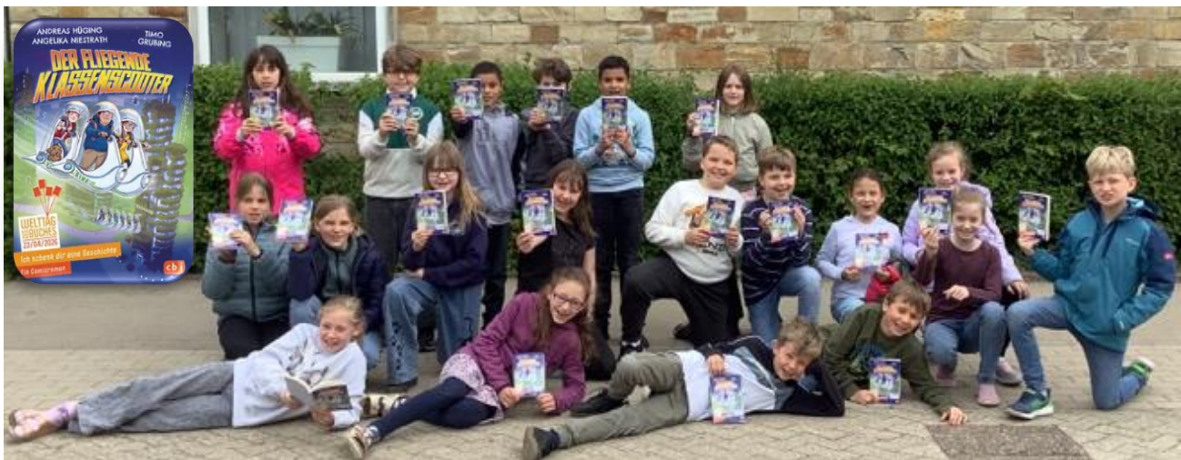
Die Klasse 4c hat sich sehr gefreut und dankt stellvertretend für alle drei Klassen!

Zum Welttag des Buches am 23. April haben auch in diesem Jahr die Kinder des 4. Jahrgangs einen eigens für diesen Zweck herausgegebenen Comic-Roman geschenkt bekommen. Wir danken der Buchhandlung Nicolibri ganz herzlich, die uns auch in diesem Jahr bedacht hat.